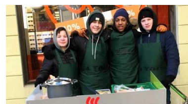
You solutions EB: Lager måltid av utgåtte matvarer og deler ut til hjemløse