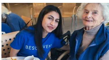
Bestevenn EB: Besøksvenn på eldrecenter